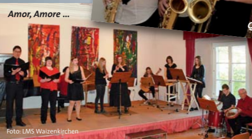
Amor, Amore ...