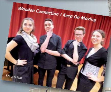
Wooden Connection / Keep On Moving