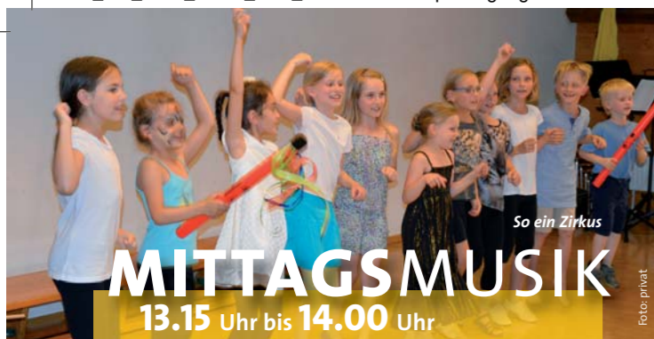
So ein Zirkus