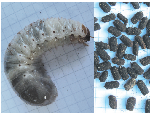
Abb. 1: Larve (L3) und Larvenkot von Osmoderma eremita. Ladendorf (NÖ), 30.08.2008.