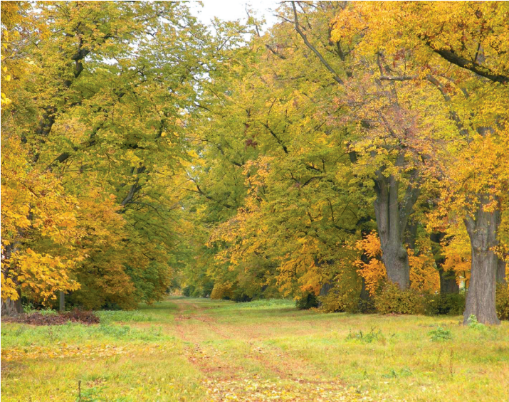
Abb.2: Lebensraum von Osmoderma eremita. Lindenallee bei Ladendorf (NÖ), 28.10.2009.