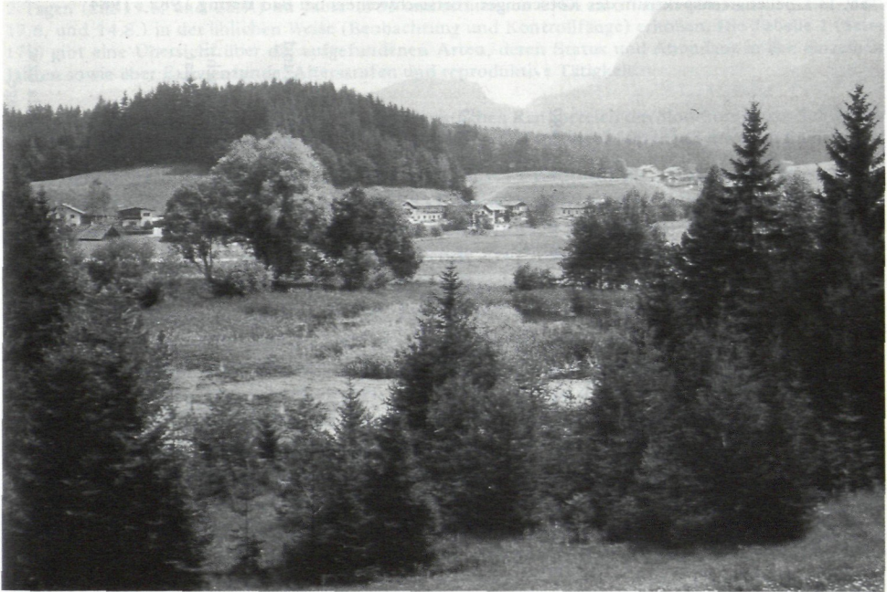
Abb. 2: Gesamtansicht des Köttschinger Torfstichweiher bei Bad Häring, Blickrichtung Ost, Aufnahme: 14.7.1982

chert – machten Sanierungsmaßnahmen nötig, welche die Gemeinde Häring in Zusammenarbeit mit den zuständigen Forst- und Naturschutzbehörden und der Universität durchführte. Dabei wurde im Winter 1984/85 der südöstliche Teil (ca. 1/3 des Gesamtareals) durch Baggerung ausgeräumt und auf etwa 3 m eingetieft. Allerdings ist die anfänglich behutsame Vorgangsweise bei der weiteren Durchführung der Arbeiten leider ins Gegenteil umgeschlagen und über das wünschenswerte Maß hinausgegangen. So wurden etwa zur Aufschüttung eines Weges größere Mengen Kalkschotter in den empfindlichen Moorbereich eingebracht, das Südufer wurde bis tief hinunter mit Holzstämmen verbaut, und anderes mehr. Aus biologischer Sicht wurde dadurch die bestehende Situation gründlich und teilweise unwiderruflich gestört. Der Status als Naturdenkmal erscheint mit dem erfolgten Ausbau und der Nutzung als Kurpark nicht mehr gegeben.