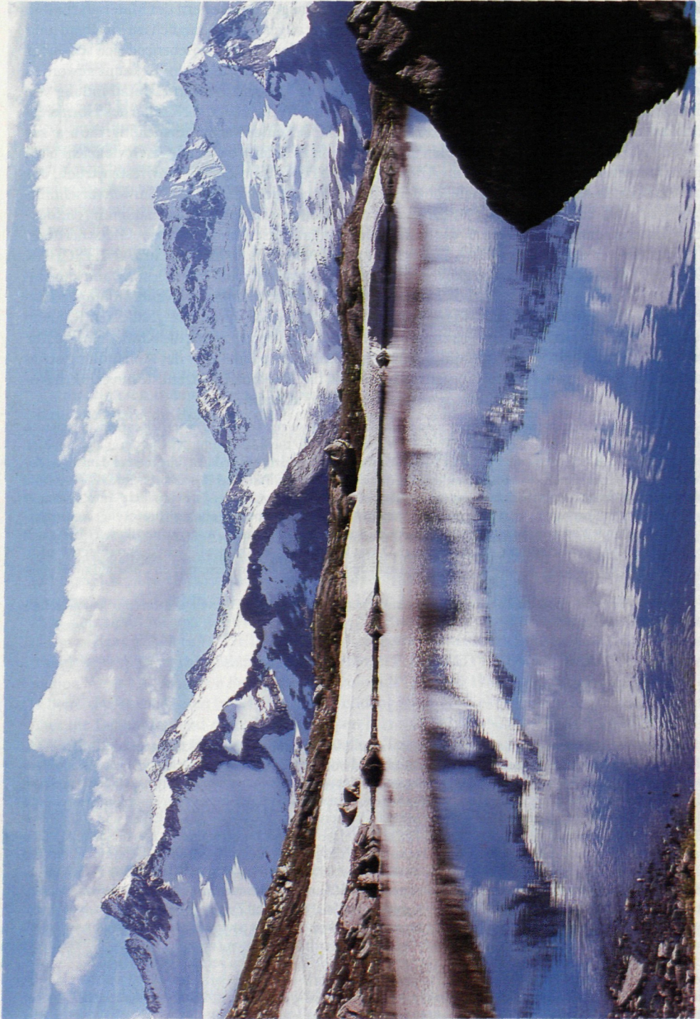
Abb. 1: Umrahmung des Hornkees-Beckens vom Schwarz-See aus. Von links: Berliner Spitze (3523 m) mit Hornschneide, Hornspitzen, Trattenjoch (3040 m), Turnerkamp (3418 m), Robruggspitze (3304 m) mit Robrugg. Siehe dazu Abb. 1: Karte des Untersuchungsgebietes mit den Lokalitäten-Nummern. Photo: Hruschka, Mayrhofen, 1972.