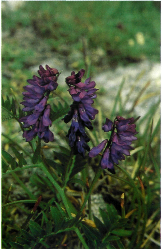
Abb. 2: Vicia oreophila , Fundort: Gunzenbergalm auf der Grebenzen, 1993.

Noch nicht endgültig abgeklärt ist die taxonomische Einstufung dieser Sippe – BALL in TUTIN & al. (1968:131) schlägt vor, sie als Unterart zu Vicia cracca L. zu stellen –, und auch ihre Verbreitung in den europäischen Gebirgen ist, wie das überraschende Vorkommen in Kärnten zeigt, noch ungenügend untersucht.