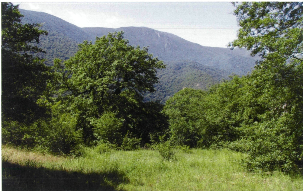
Abb. 3: Der Lebensraum von Stigmella gutlebiella sp. n. in Tange Gol.

Typenfundort Tange Gol ausschließlich Nepticulidae-Arten mit Bindung an Laubwaldstrukturen nachgewiesen (Daten wie bei Stigmella gutlebiella sp. n.):