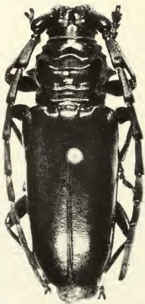
Abb. 1. Trachyderes steinhauseni spec. nov., Holotypus ♀.

Elytren gestreckt und konvex, mit geschlossenen Schulterbeulen, apikal schwach abgestutzt mit breit abgerundeten Winkeln, leicht lederartig verrunzelt und doppelt – äußerst fein und wenig dicht und etwas stärker und weitläufig – punktiert (bei 40 x). Die Punktierung bis zur Spitze deutlich. An den Rändern und im Apikalviertel äußerst fein, staubartig behaart.