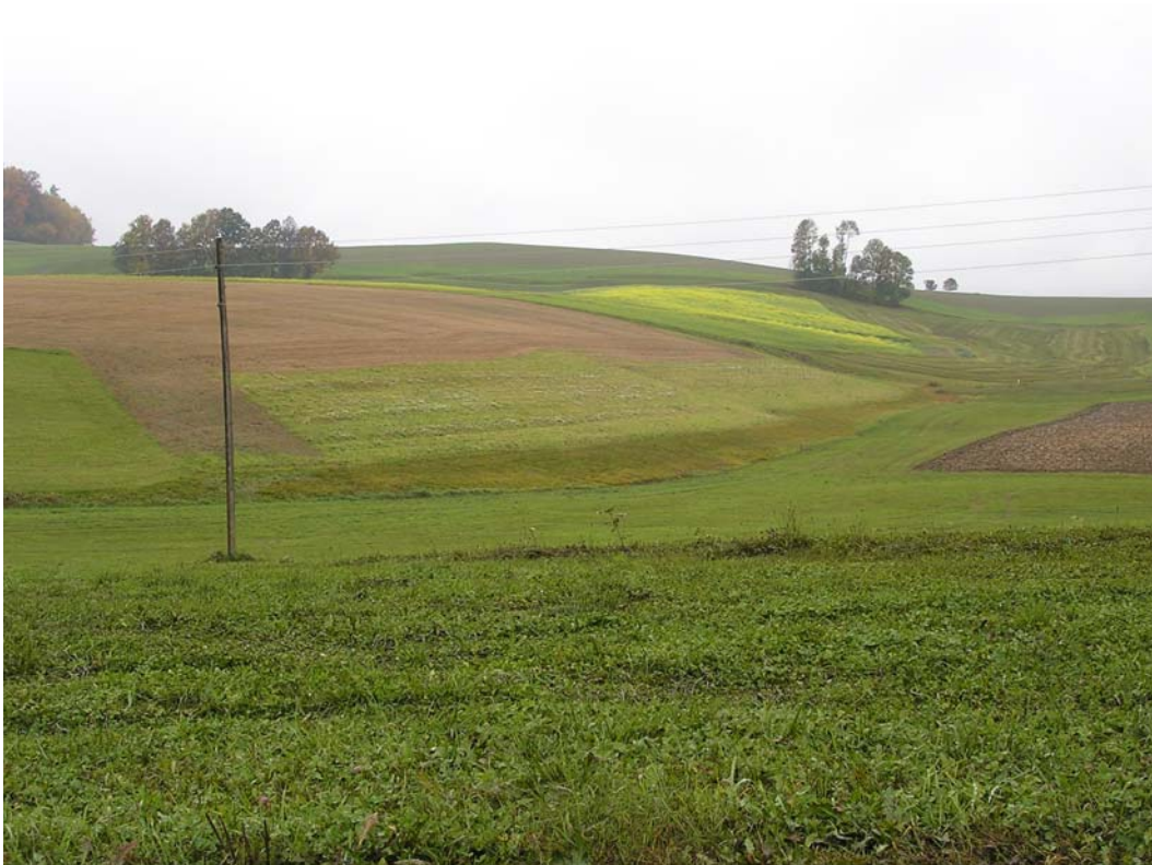
Abb. 1: Feuchtwiesenstreifen an Gemeindegrenze