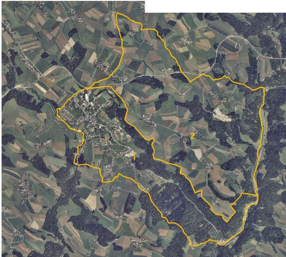
Abb. 2: Übersicht Erhebungsgebiet mit Abgrenzung der Teilgebiete und Orthophotos

Teilgebiet 1: Landwirtschaftliches Intensivgebiet mit bewaldeten Bachtälern