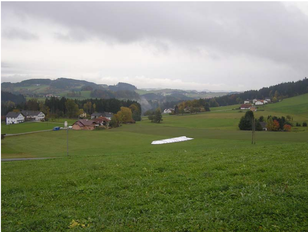
Abb. 3: Teilraum Blick Richtung Süden