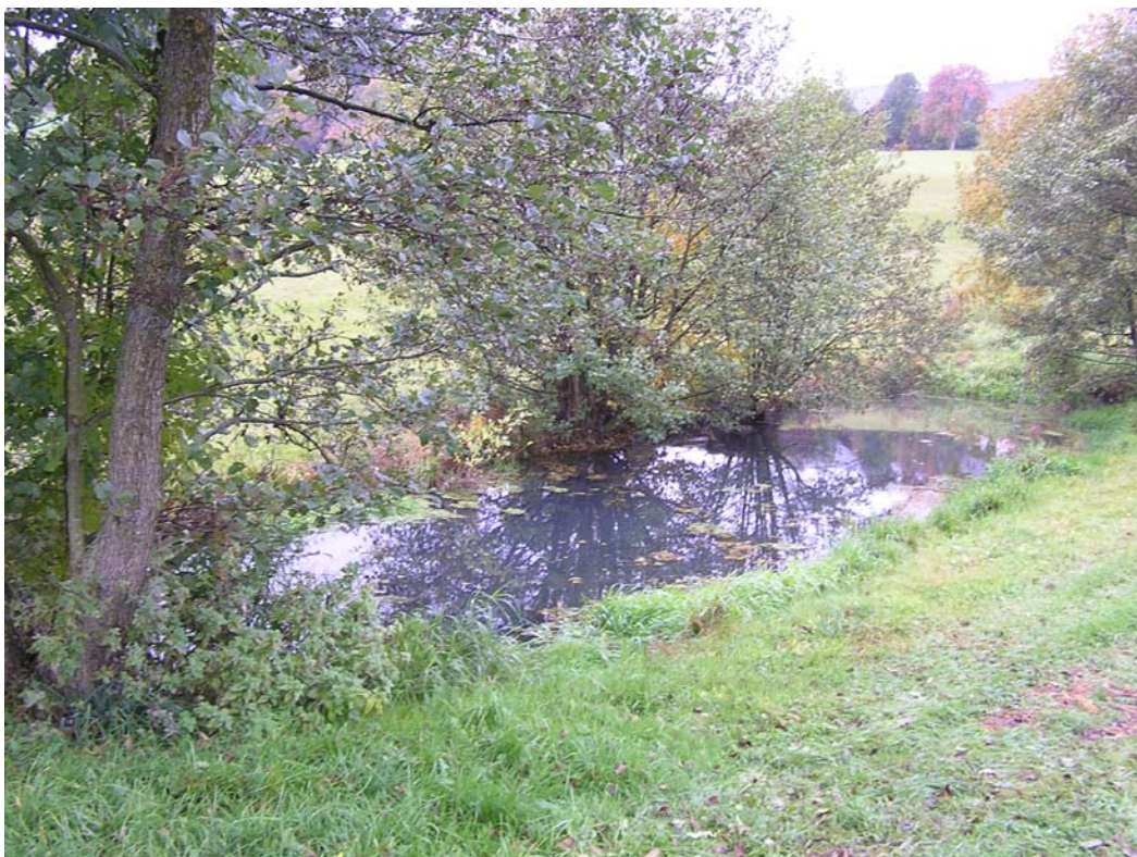
Abb. 2: Teichanlage