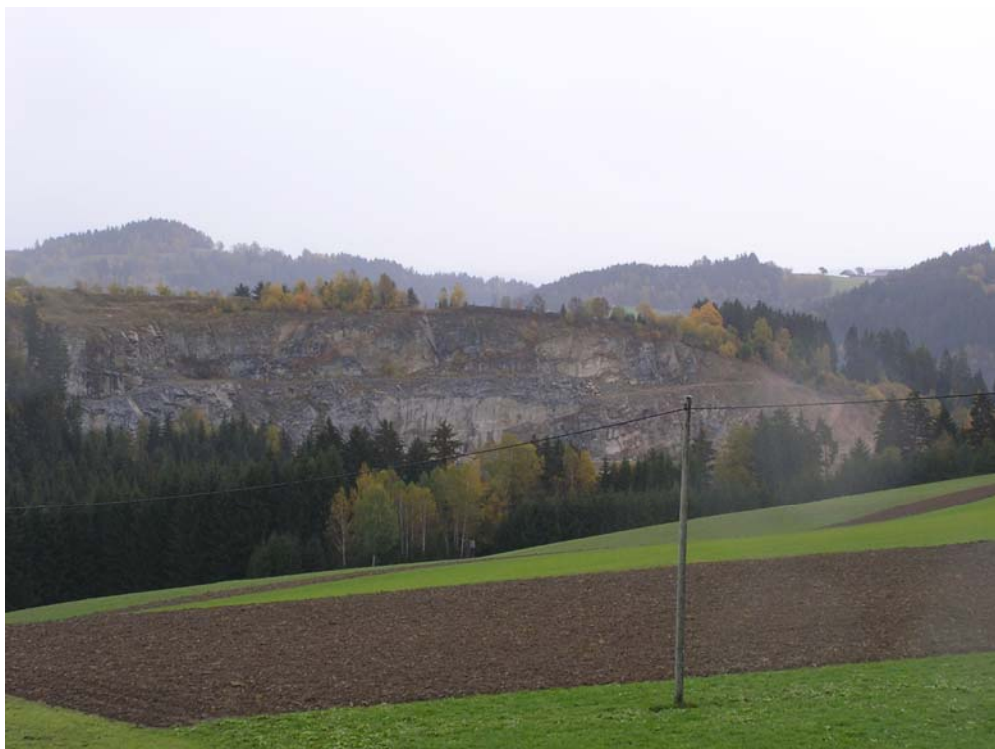
Abb. 6: Steinbruch