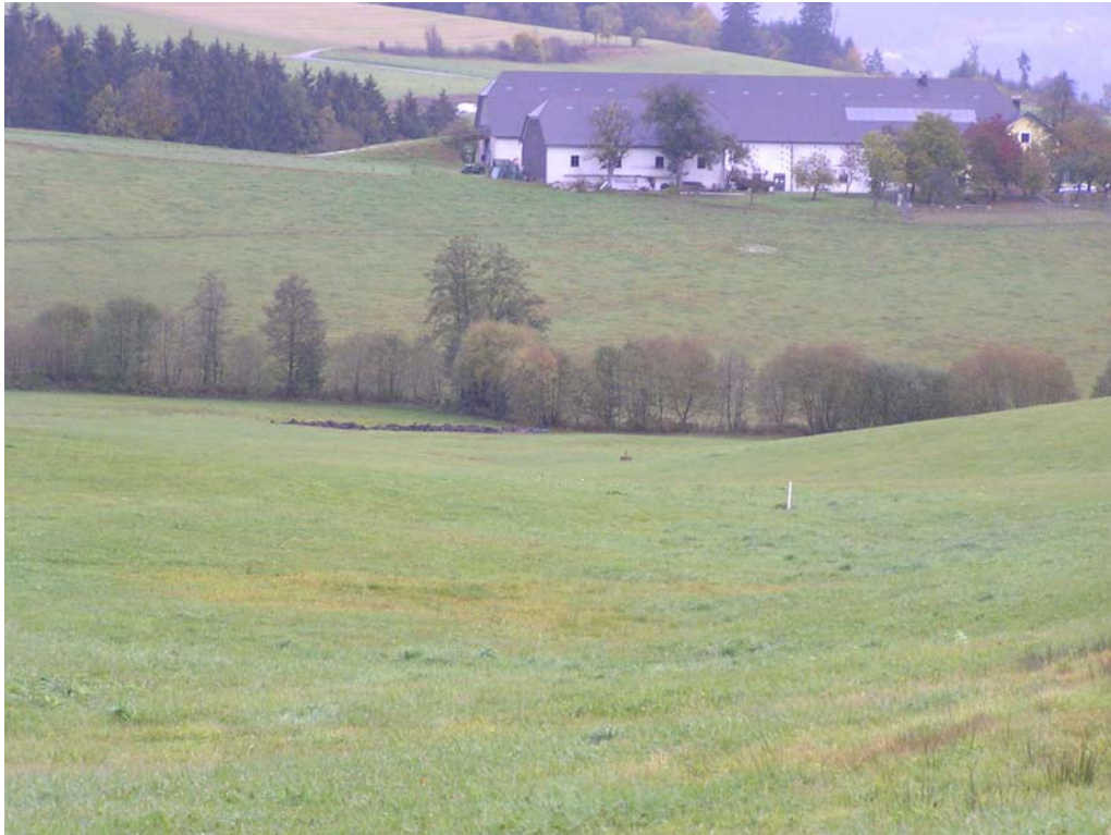
Abb. 7: Bachufergehölz eines namenlosen Baches