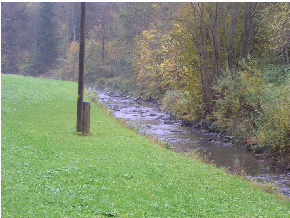
Abb. 4: Kleine Mühl