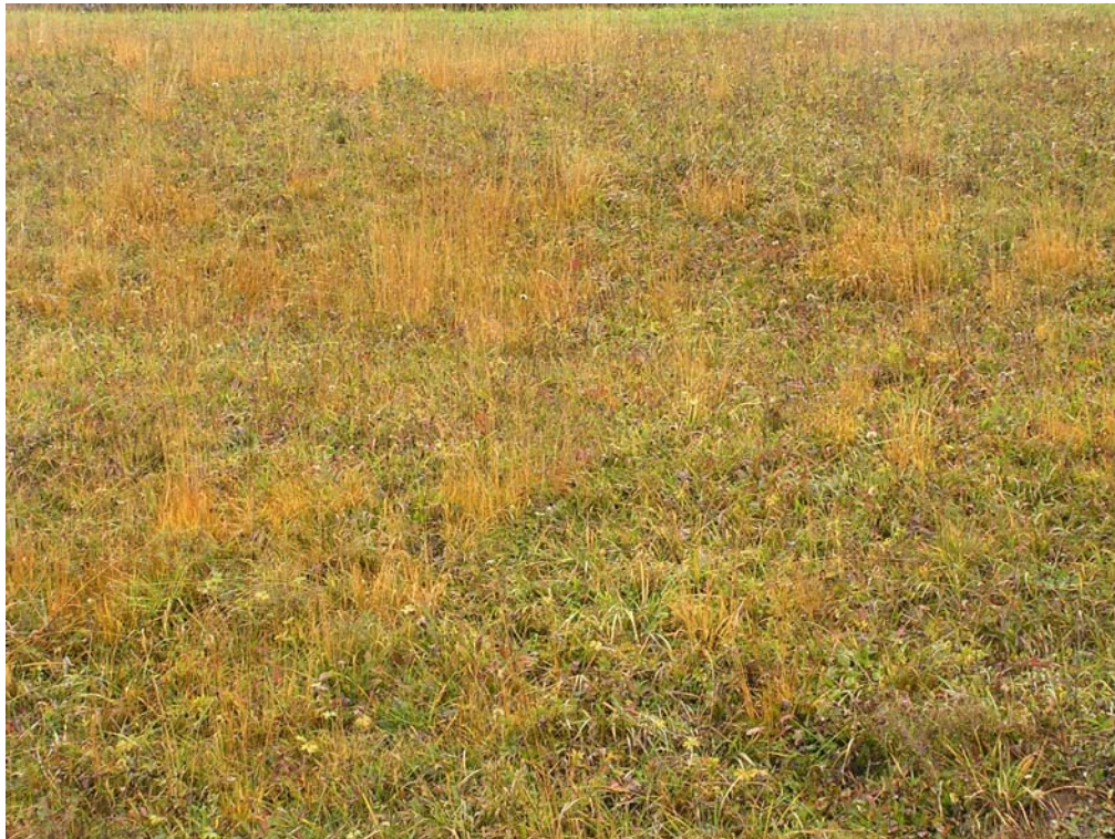
Abb. 5: Magerrasen