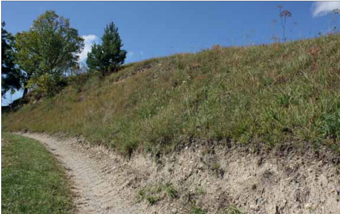
Abb. 3: Xerotherme Wegböschung in Maltschach (LB, Leutschach). Lebensraum von Lasius paralienus . Syntop wurden Tetramorium sp., Camponotus ligniperda , C. piceus , Lasius niger , Formica cunicularia , F. rufibarbis , F. pratensis und F. sanguinea gefunden.