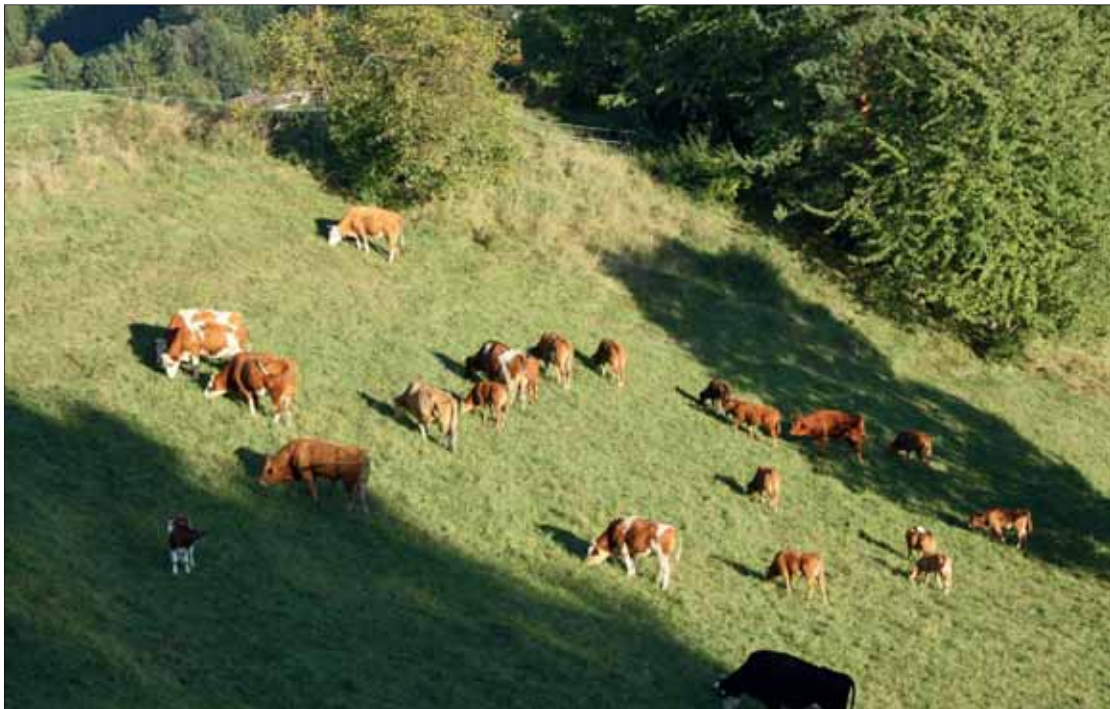
Abb. 6: Magerweide in Prongegg (LB, Arnfels). In den Randbereichen der Weide lebt Lasius paralienus . Syntop treten Myrmica sabuleti , Tetramorium cf. caespitum ( p = 0,82 ), Camponotus aethiops , Formica fusca , F. pratensis und F. sanguinea auf.