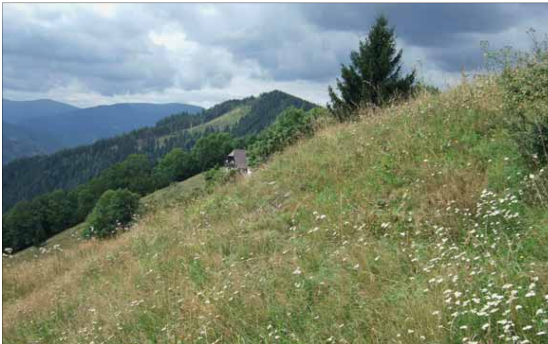
Abb. 4: Reicherhöhe (GU, Übelbach). Verbrachte Magerwiese. Hier wurde Lasius paralienus gefunden. Syntop treten Myrmica rubra , Temnothorax nigriceps , Tetramorium sp., Tapinoma ambiguum , Camponotus ligniperda , Formica cunicularia , F. rufibarbis und F. sanguinea auf.