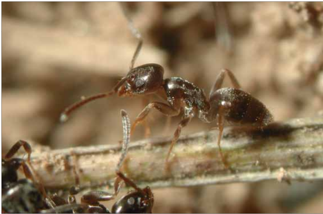
Abb. 1: Tapinoma ambiguum .