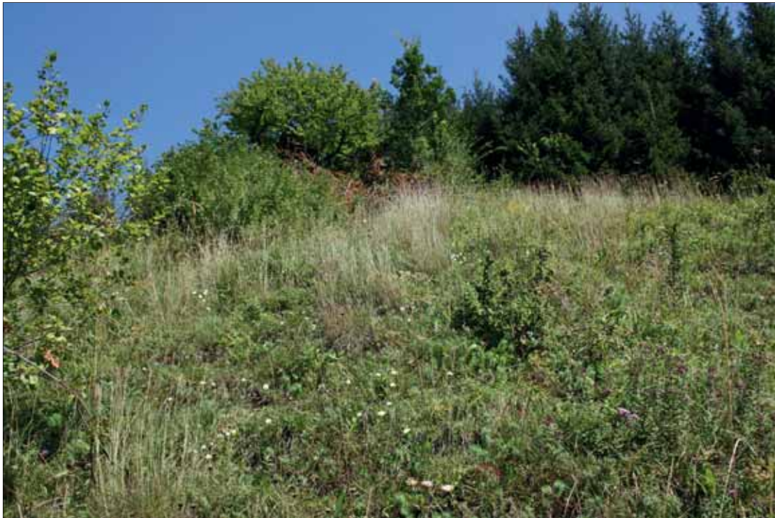
Abb. 7: Schipferwiese (LB, Eichberg-Trautenburg, SW Kreuzberg). Lebensraum von Lasius alienus . Syntop leben hier Myrmica sabuleti , Tetramorium cf. caespitum ( p = 0,76 ), Dolichoderus quadripunctatus und Formica sanguinea .