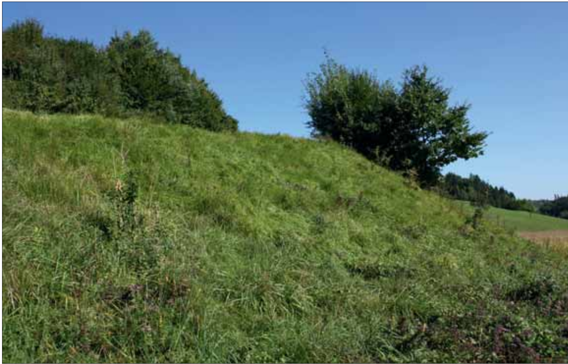
Abb. 5: Böschung in Kranach (LB, Leutschach). Lebensraum von Lasius paralienus , sowie Myrmica sabuleti , M. rubra , Solenopsis fugax , Prenolepis nitens , Lasius niger , L. flavus , Formica cunicularia , F. rufibarbis und F. pratensis .