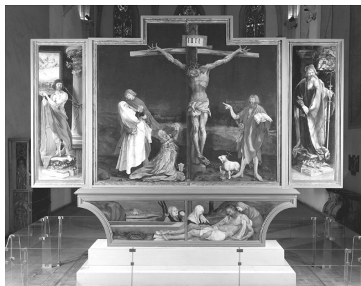
Isenheimer Altar, Musée d'Unterlinden, Colmar