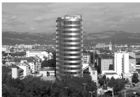
Wissensturm Linz

Mit dem 63 Meter hohen, 16-geschoßigen Bau in unmittelbarer Nähe zum neu gestalteten Hauptbahnhof hat die Stadt Linz einen starken städtebaulichen Akzent und ein starkes Signal für Bildung, lebensbegleitendes Lernen und Kultur gesetzt. Das architektonische Grundkonzept stammt von den beiden Linzer Architekten Dipl.-Ing. Franz Gneidinger und Dipl.-Ing. Manfred Diessl und wurde vom Linzer Gestaltungsbeirat wegen der „phantasievollen und städtebaulich sensiblen Formulierung des Baukörpers“ gelobt. Durch die Konzentration der Volkshochschule und der Stadtbibliothek an einem Standort können die Stärken der beiden Einrichtungen optimal genutzt werden. Neben