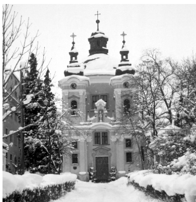
Wallfahrtskirche Christkindl