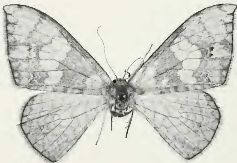
Abb. 2: Agnidra alextoba sp. n. ♀ Paratypus.