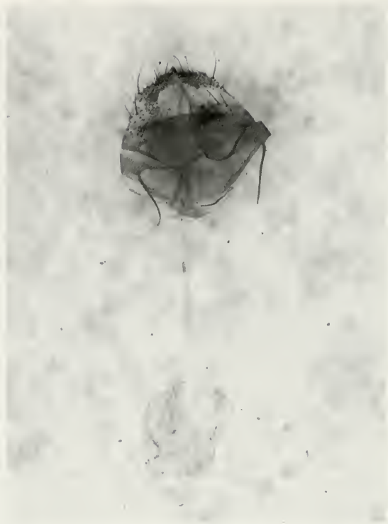
Abb. 4: Agnidra alextoba sp. n., weibliches Genital.

kurze Socii, Vinculum länger und schmaler, Valven länger und schmaler. Bei A. fuscilinea Socii paarweise, Valven mit tiefem Einschnitt, geteilt, Vinculum lang und schmal.