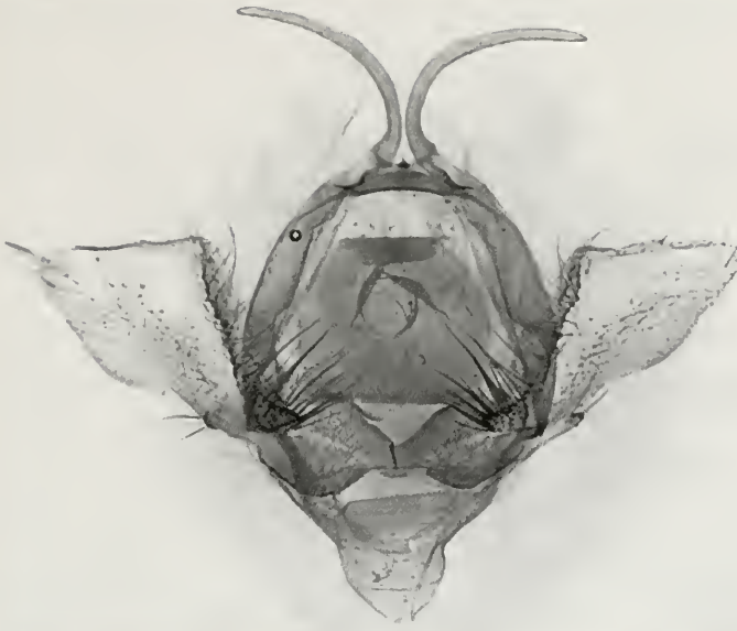
Abb. 3: Agnidra alextoba sp. n., männliches Genital.