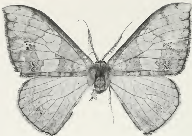
Abb. 1: Agnidra alextoba sp. n. ♂ Holotypus.