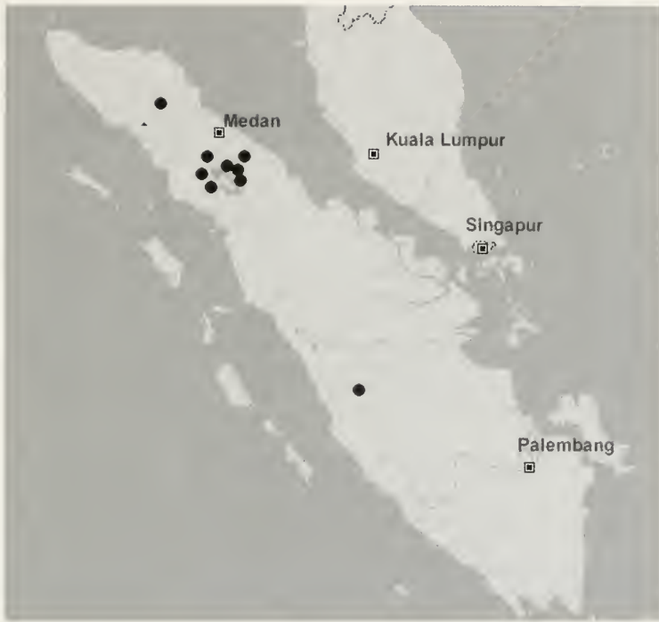
Abb. 5: Bisher bekannte Verbreitung von Agnidra alextoba sp. n. auf Sumatra.