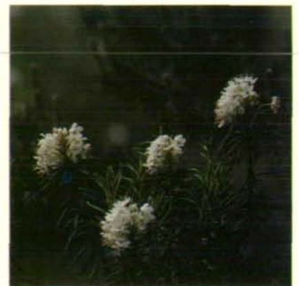
Abb. 4: Blühender Sumpfporst ( Ledum palustre )

Als weitere Kostbarkeit des Tannermoores kann der als „Glazialrelikt“ bezeichnete Laufkäfer „ Carabus menetriesi “ erwähnt werden.