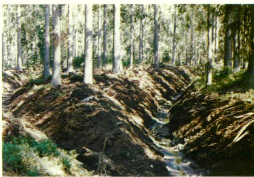
Abb. 7: Zerstörung durch neu gezogene Entwässerungsgräben

Von den angrenzenden Gemeinden des Tannermoores wurde ein Moorlehrpfad errichtet, der seinen Ausgang an dem auch mit dem Fahrzeug erreichbaren Rubnerteich nimmt, und in einer durch den S-Moorbereich führenden Schleife zum Ausgangsbereich zurückführt.