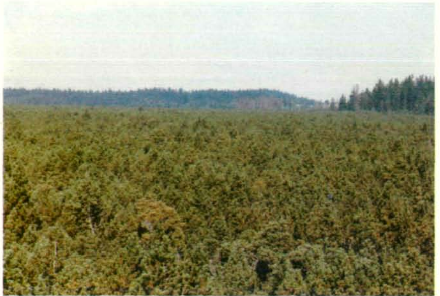
Abb. 3: Nördliche Latschenmoorfläche mit Fichteninseln

Nach diesem Ausflug in die Vergangenheit verstehen wir auch die heutige Physiognomie des Moores als Momentaufnahme in einer jahrtausendelangen Entwicklung. Die heute mit wenigen Ausnahmen in den zentralen Bereichen geschlossene Legföhrenbedeckung (siehe Abb. 3) ist das Resultat dieser über den Grundwasserspiegel emporwachsenden Torfmoosdecke. Ein eigentlicher Randsumpf (Lagg), wie er Moore niederschlagsreicherer Gebiete auszeichnet, fehlt hier oder ist nur im N-Bereich angedeutet (mit Carex rostrata ). Die Föhrenzone leitet allmählich in den anmoorigen Fichtenrandwald über: eine Ausbildung wie sie K. RUDOLPH und F. FIRBAS als typisch für die böhmischen Moore dieser Höhenlagen erachteten. Diese Entwicklung leitet zu den kontinentaleren Hochmoortypen über, die H. OSVALD „Waldhochmoor“ nennt. Für diese bezeichnend ist, daß Bünten (Torfhügel) nur flach ausgebildet