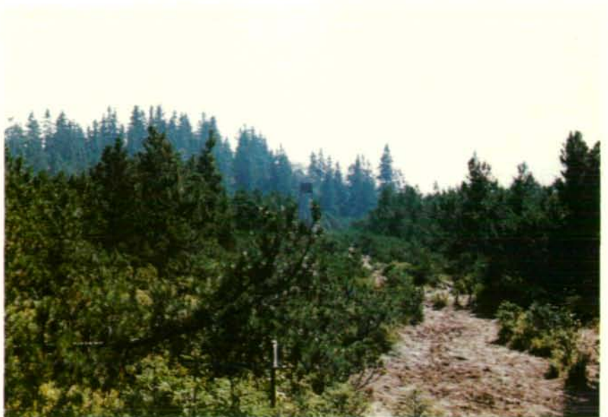
Abb. 5: Moorwanderweg im Bereich des Legföhren/Spirken-Filzes