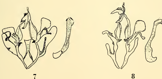
Fig. 7: Génitalia mâle de (Male genitalia of) Achaea nigristriata n. sp. (45 : 1).

Femelle : De taille identique à celle du ♂. Elle en diffère cependant par la couleur fondamentale des ailes antérieures plus noire. Lignes antémédiane, médiane, et subterminale présentes et soulignées d'une fine ligne blanc bleuâtre. Il y a à l'apex une importante tache marron clair, et au bord externe de l'aile il y