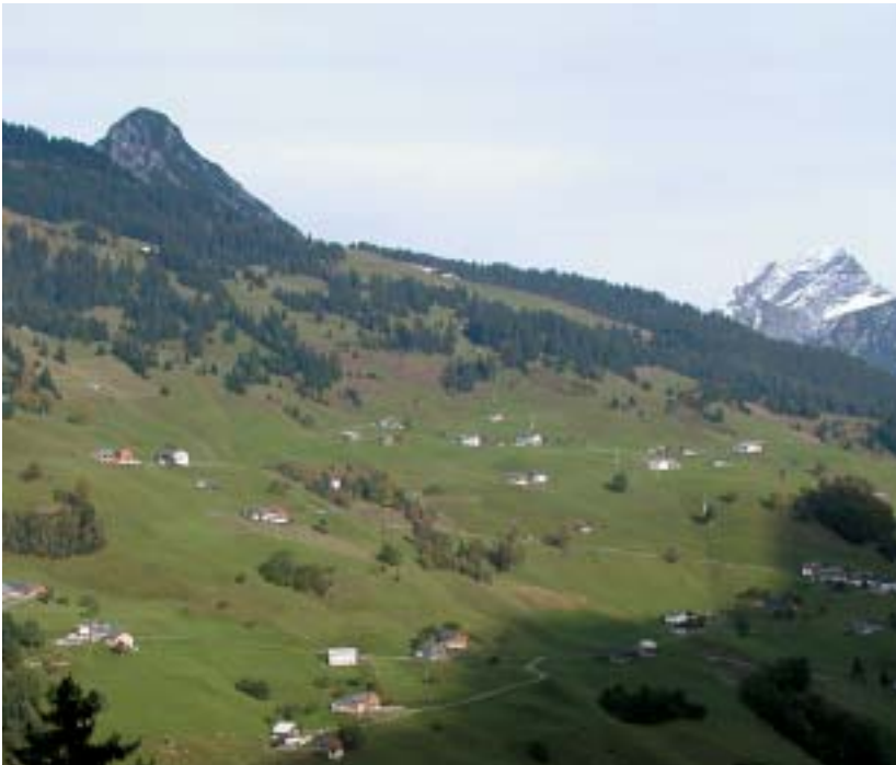
Abb. 1: Blumenwiese – Blick in die Berge