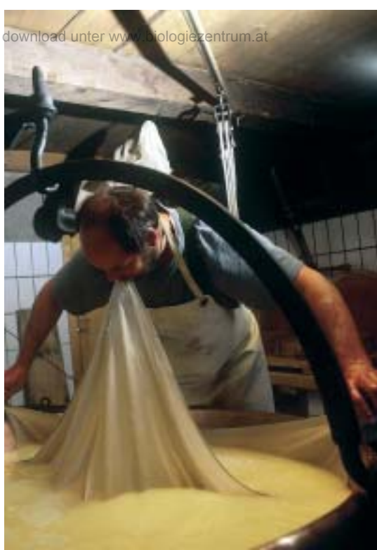
Abb. 8 (l.): Produkte (köstlicher Käse)