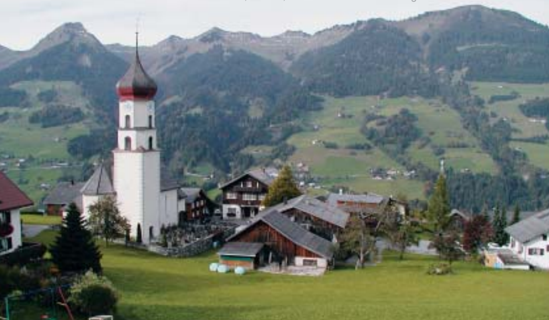
Abb. 3: Dorfzentrum Raggal

Die naturbürtigen Voraussetzungen – steile und rutschende Hänge sowie ein raues Klima zwangen zur Anpassung der Lebensweise. Einige Terrassen boten die Möglichkeit zur Anlage von Weilern und einer Ortsmitte. Viele Höfe sind jedoch in Einzellage errichtet und von Wiesen und Weiden umgeben. Die kurze Vegetationsperiode erforderte es, eine differenzierte Grünlandwirtschaft zu entwickeln. Es wurden und werden mit dem Vieh periodische Wanderungen durchgeführt, die jeden Sommer vom Heimhof über die Maisäss zu den Alpen und wieder retour führen. Maisässe befinden sich zwischen dem Heimhof und dem Alpgebiet und sind durch allemannische Namen als Einrichtung der Walserinnen und Walser erkennbar und entsprechen der in den Westalpen gängigen Staffellwirtschaft. Die Walserinnen und Walser betrieben schon früh ausgeprägten Handel, da in dieser Lage viele Lebensmittel nicht mehr gut gedeihen. Sie konnten sich mit Milch, Käse und Fleisch selbst ernähren und erwarben den Rest aus Tausch – oder bald auch aus Geldhandel. Zahlreiche Säumerwege, Herbergen und Gasthöfe sind überliefert wie unter anderem von LG (1949) erläutert wird.