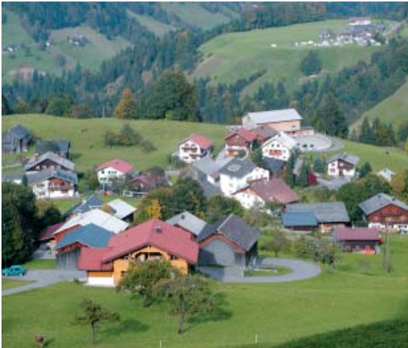
Abb. 6: Streusiedlung Raggal