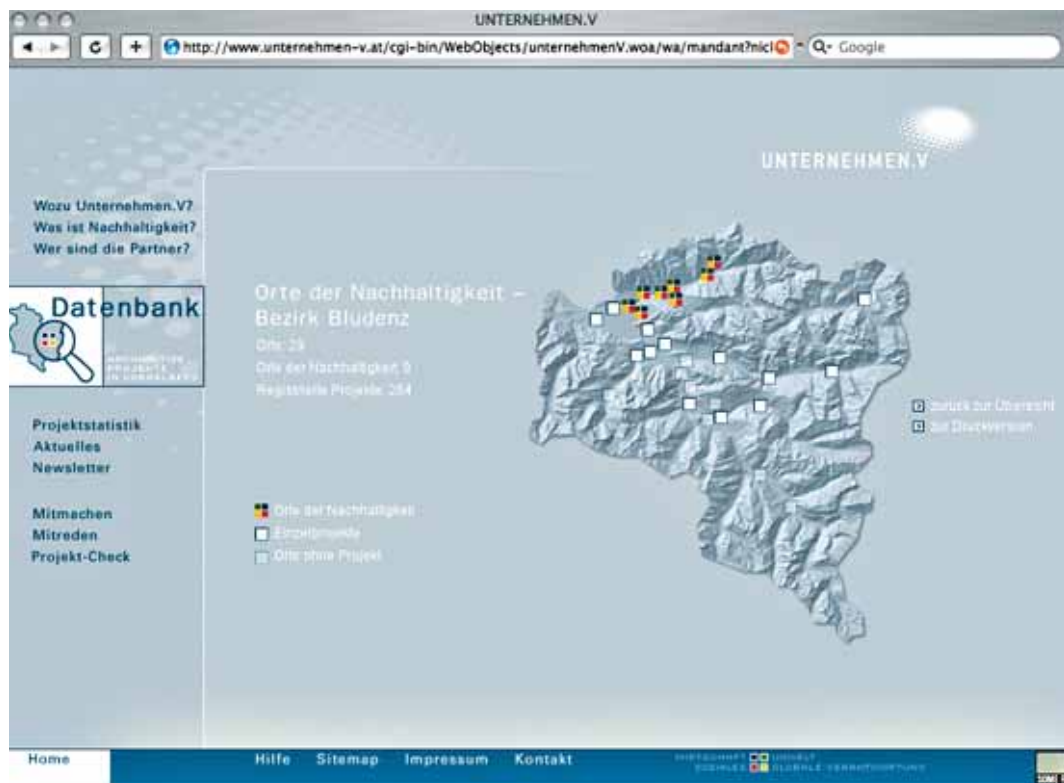
Abb. 3: Screenshot www.unternehmen-v.at , der die geografische Abfrage der Datenbank zeigt. Regionen oder Gemeinden, die im Sinne der Agenda 21 arbeiten, werden mit dem 4-farbigem Logo gekennzeichnet

Nach Eingabe der Bewertungsergebnisse und Prozess-Checkliste durch die jeweiligen Gemeinde-BetreuerInnen wird die Gemeinde im System freigeschaltet und scheint somit als «Ort der Nachhaltigkeit» auf.