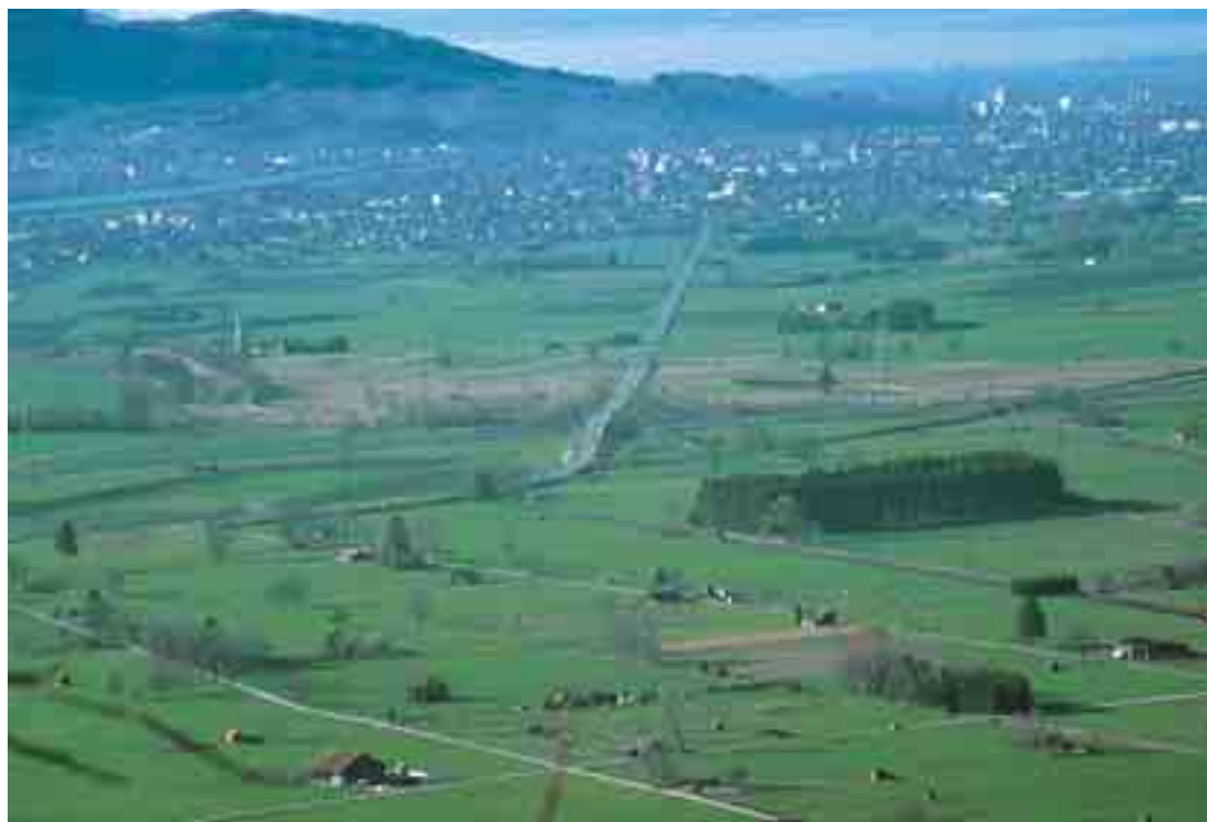
Abb. 1: Das Naturschutzgebiet Gsieg – Obere Mälder liegt inmitten des nördlichen Alpenrheintals. Das braungetönte Teilgebiet Obere Mälder hebt sich deutlich vor Lustenau und den Ausläufern der Appenzeller Berge ab