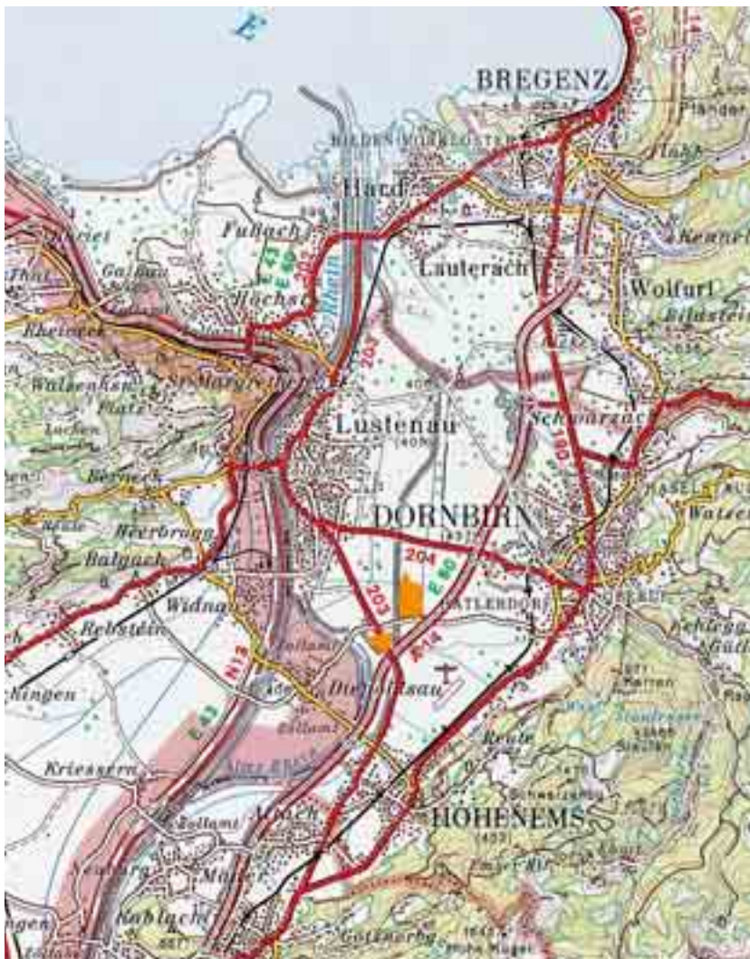
Abb. 2: Lageplan des Naturschutzgebietes (Kartengrundlage: Österreichische Karte 1 : 200.000, Blatt Vorarlberg, Ausgabe 1996)