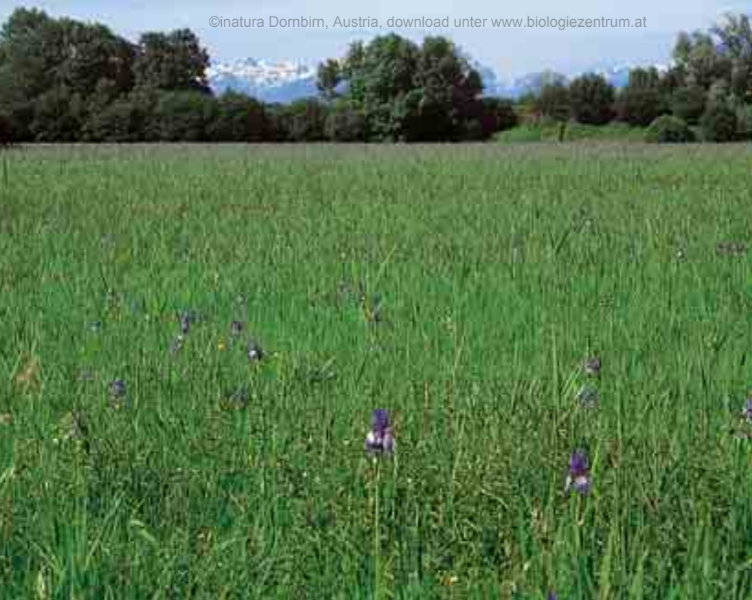
Abb. 4: Anfang Juni verwandeln sich die Streuwiesen im Gebiet Obere Mähder in ein blaues Schwertlilien-„Meer“

Mit der Erweiterung des Lustenauer Naherholungsgebietes am Alten Rhein in Richtung Süden wurde dieser bemerkenswerte Landschaftsteil in den letzten Jahren einem breiteren Kreis von Erholungssuchenden zugänglich gemacht. Ohne besondere Beeinträchtigung der störungsempfindlichen Streuwiesen kann der Naturfreund heute vom Seelachendamm aus (nahe dem Grenzübergang Lustenau – Diepoldsau-Schmitter) die reichhaltige Landschaft an der Schnittstelle zwischen Altem Rhein und Ried erwandern und sich anhand des 1997 neu errichteten Naturlehrpfades einen Überblick über die schutzwürdige Natur verschaffen.