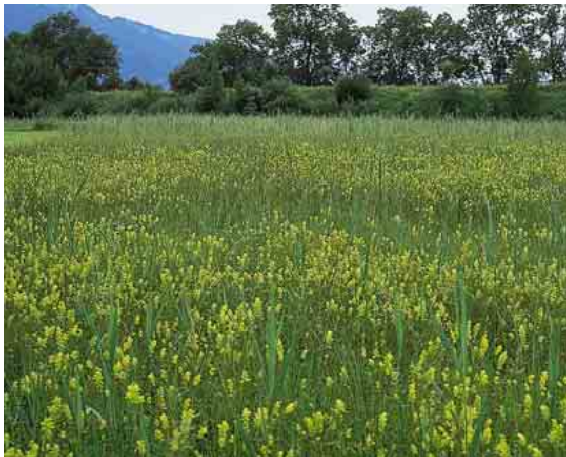
Abb. 3: Klappertopf-Aspekt in den Pfeifengraswiesen der Oberen Mähder

Während der größeren Teilfläche Gsieg lagebedingt weniger Beachtung geschenkt wird, ist der blaue Iristeppich der Oberen Mähder südlich des Gasthauses Schweizerhaus wohl den meisten, die die Strecke von Lustenau nach Hohenems fahren, ein Begriff. An kaum einer anderen Art wird der dramatische Rückgang der Feuchtwiesen so deutlich wie an der Sibirischen Schwertlilie ( Iris sibirica ). Noch vor 50 Jahren erfüllte das Blau der „Ilggen“ das Rheintal vom Bodensee bis nach Nenzing, heute ist ihr Vorkommen auf kleine Restbestände zurückgedrängt!