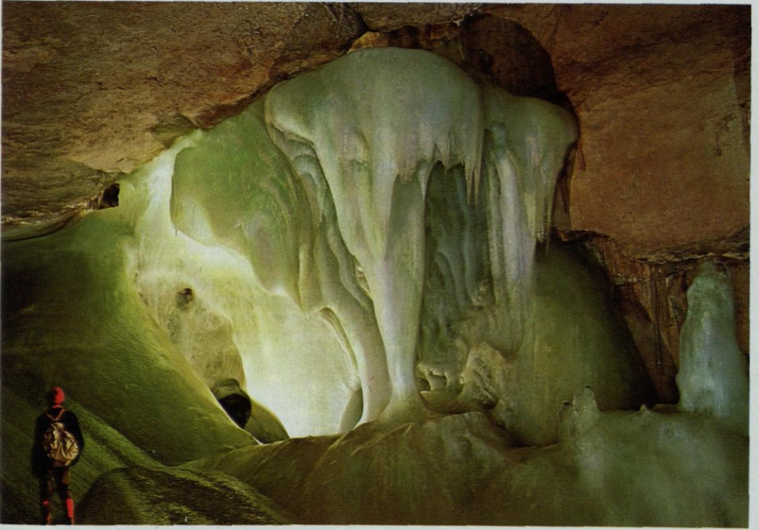
Abb. 23: Eine mächtige Boden- und Deckeneisformation, die »Gralsburg«, in der Dachstein-Eishöhle.