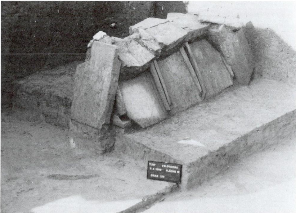
Wilten — VELDIDENA, Umspannwerk, Ziegelplattengrab

diktinerstiftes urnenfelderzeitliche Brandgräber entdeckt wurden. Eine umfangreiche und sorgfältige Untersuchung will das Ferdinandeum nach Abschluß der Grabungen Innsbruck-Wilten durchführen. Da der derzeit landwirtschaftlich genutzte Grund noch nicht von Bauvorhaben bedroht ist, kann mit diesem Grabungsvorhaben noch etwas zugewartet werden.